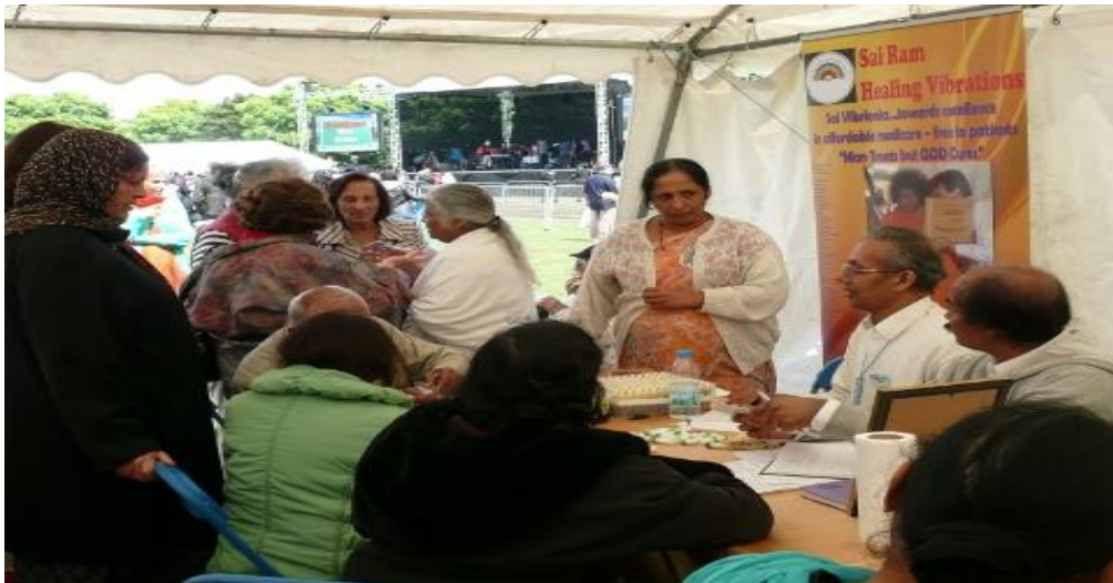
Chiosco di Vibrionica alla festa dell'Unità delle Fedi nel Southall Park, Londra