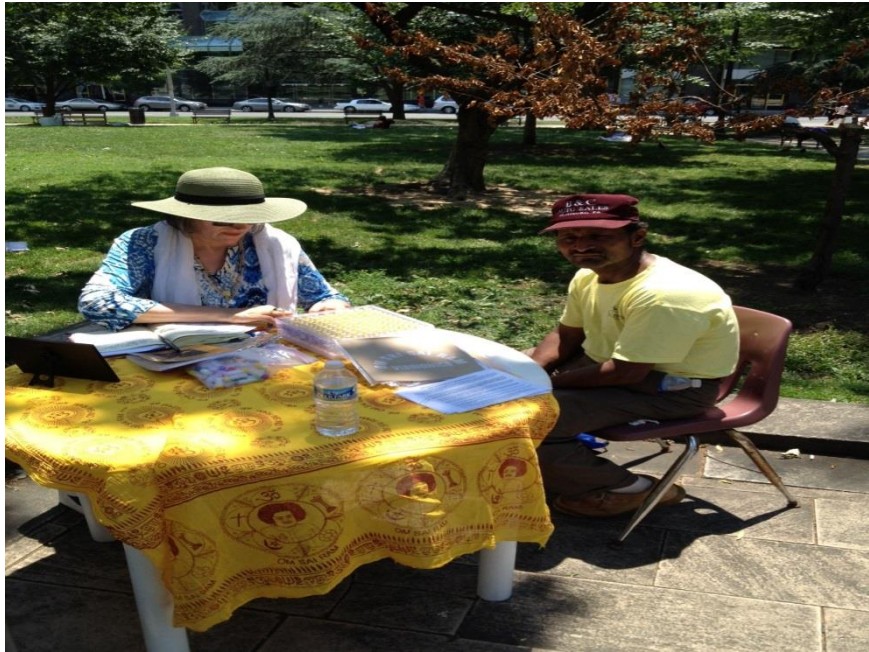
Vibrionica nel Parco – Servizio ai senzatetto Washington DC USA